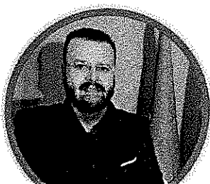
GIUSEPPE FAVILLA SECONDARIA DI SECONDO GRADO

DOCENTI, ATA, INSEGNANTI DI RELIGIONE PER LA SCUOLA